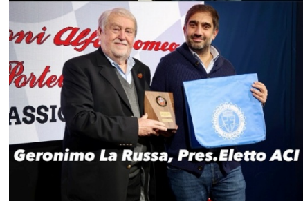
Geronimo La Russa, Pres. Eletto ACI